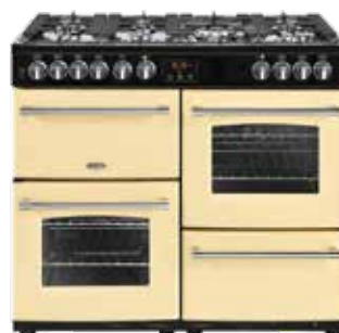
Farmhouse 100 DFT 100 CM

Dessus de la cuisinière 7 brûleurs à gaz (wok 4 kW) Supports de casseroles en fonte Fond de table émaillé sans soudure