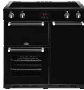
Kensington 90 Ei 90 CM

Pour une utilisation domestique courante, nous recommandons d'utiliser au moins du triphasé de 230V et 16 ampères (fiche/ raccordement péritel). Nous recommandons de faire appel à un installateur agréé pour réaliser le raccordement. Le bloc de raccordement pour le raccordement électrique se trouve à l'arrière au milieu. Le cordon et la fiche ne sont pas fournis. Pour toutes les caractéristiques techniques, se reporter page 50.