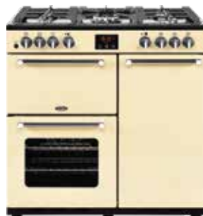
Kensington 90 DFT 90 CM

Pour toutes les caractéristiques techniques, se reporter page 44.