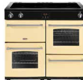
Farmhouse 100 Ei 100 CM

Dessus de la cuisinière 5 zones de cuisson induction (fonction boost) (2x 2,0 kW, 2x 1,4 kW, 1x 3,0 kW) Fonction Bridge