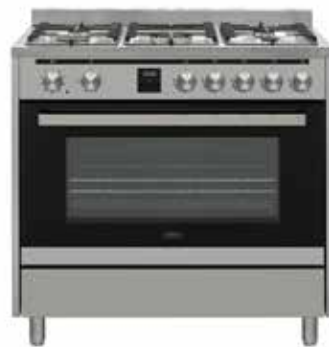
Derby 900 DFT 90 CM

Ce four possède un cordon de 1,4 mètre avec une fiche normale. Aucune modification n'est requise dans le placard à compteurs.