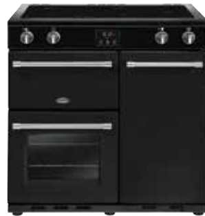
Farmhouse 90 Ei 90 CM

Dessus de la cuisinière 4 zones de cuisson induction (4x 2.1 kW) Fonction Bridge 1 zone de maintien au chaud