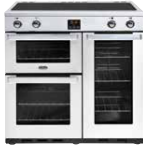
Cookcentre 90 Ei 90 CM

Pour une utilisation domestique courante, nous recommandons d'utiliser au moins du triphasé de 230V et 16 ampères (fiche/raccordement périlex). Nous recommandons de faire appel à un installateur agréé pour réaliser le raccordement. Le bloc de raccordement pour le raccordement électrique se trouve à l'arrière au milieu. Le cordon et la fiche ne sont pas fournis. Pour les conseils d'encastrement, se reporter page 50