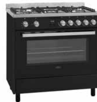
Leeds 900 DFT 90 CM