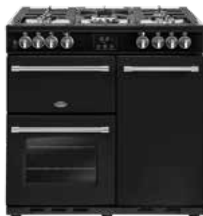
Farmhouse 90 DFT 90 CM

Dessus de la cuisinière 5 brûleurs à gaz (wok 4 kW) Supports de casseroles en fonte Fond de table émaillé sans soudure