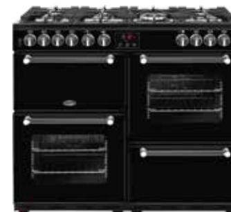
Kensington 100 DFT 100 CM