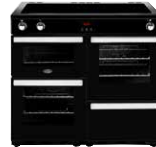
Cookcentre 100 Ei 100 CM