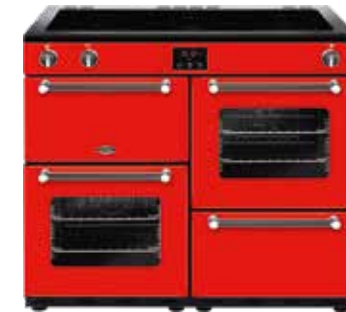
Kensington 100 Ei 100 CM