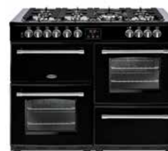
Farmhouse 110 DFT 110 CM

Dessus de la cuisinière 7 brûleurs à gaz (wok 4 kW) Supports de casseroles en fonte Fond de table émaillé sans soudure