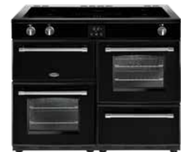
Farmhouse 110 Ei 110 CM

Dessus de la cuisinière 5 zones de cuisson induction (fonction boost) (2x 2,0 kW, 2x 1,4 kW, 1x 3,0 kW) Fonction Bridge