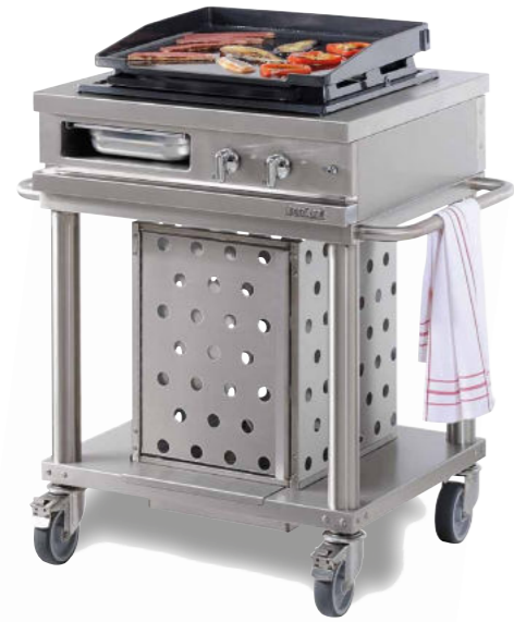
WTG 720 PL - Plancha gaz 6 kW.