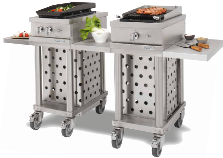
WTG 420 R + WGS + WTG 410 CKG + 2 x WTDL 325 + WTDI 350 Deux feux vifs gaz 3 kW, plaque grillade lisse amovible, gril à pierres de lave 4 kW, deux tablettes latérales et une tablette de dépose intermédiaire.

Open'Cook : des grillades 3 étoiles ! Pour sublimer la cuisson des produits frais d'été, succès assuré avec le gril à pierres de lave ou les plaques grillades lisses ou nervurées à poser sur 2 feux vifs. En famille ou entre amis, vive les grands poissons en écailles, les belles pièces de viandes, les brochettes et les légumes parfumés !