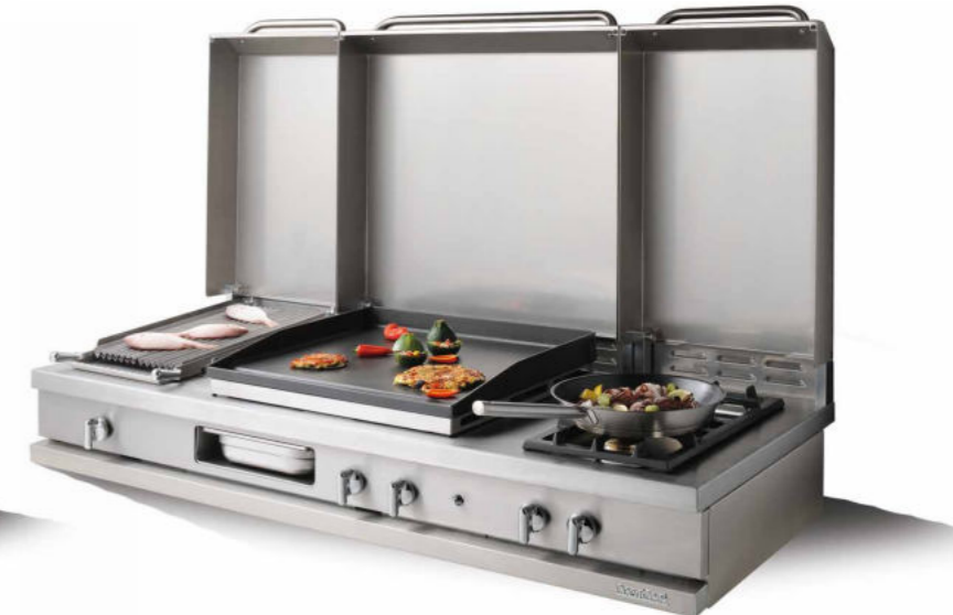
WSG 1520 PL - C + WAG 010 CKG - C + WAG 020 R - C Ensemble monobloc plancha gaz 6 kW, grill à pierres de lave 4 kW et 2 feux vifs gaz 3 kW.