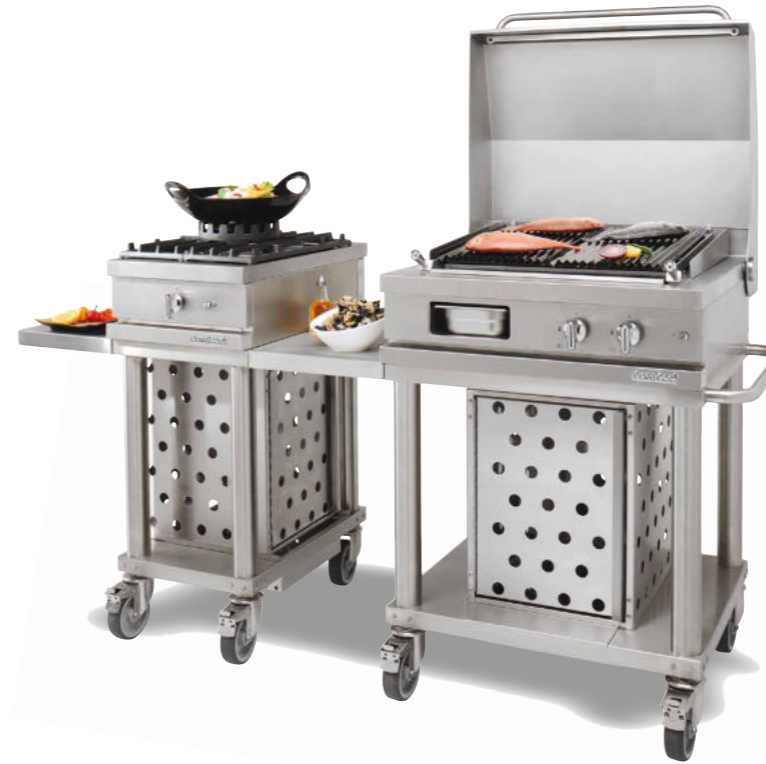
WTG 410 UR + WTG 720 CKG - C + WTDI 350 Un feu vif gaz 5 kW, gril à pierres de lave 4 kW, une tablette latérale et une tablette de dépose intermédiaire.