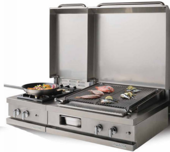
WSG 420 R - C + WSG 720 CKG - C 2 feux vifs gaz 3 kW, grill gaz pierres de lave 6,5 kW.