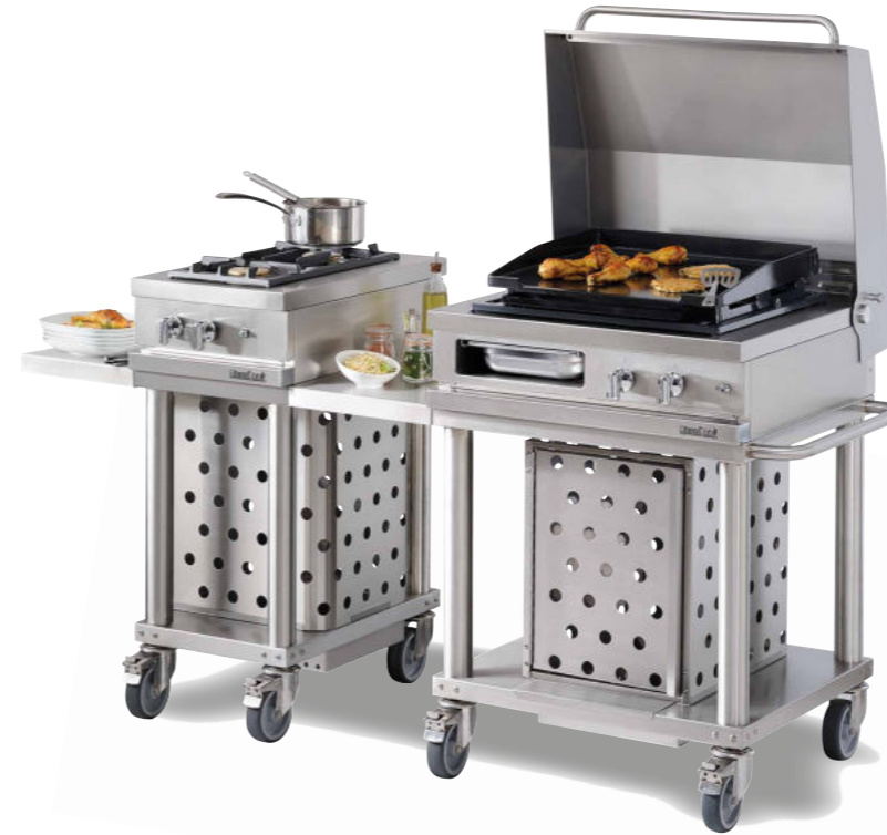
WTG 420 R + WTG 720 PL - C + WTDI 350 + WTDL 320 Table de cuisson gaz deux feux vifs 3 kW, plancha gaz 6 kW, une tablette latérale et une tablette de dépose intermédiaire.