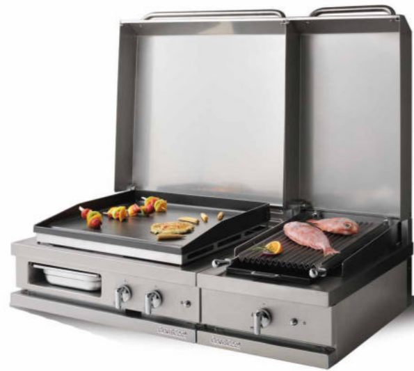
WSG 720 PL - C + WSG 410 CKG - C Plancha gaz 6 kW, grill à pierres de lave 4 kW.