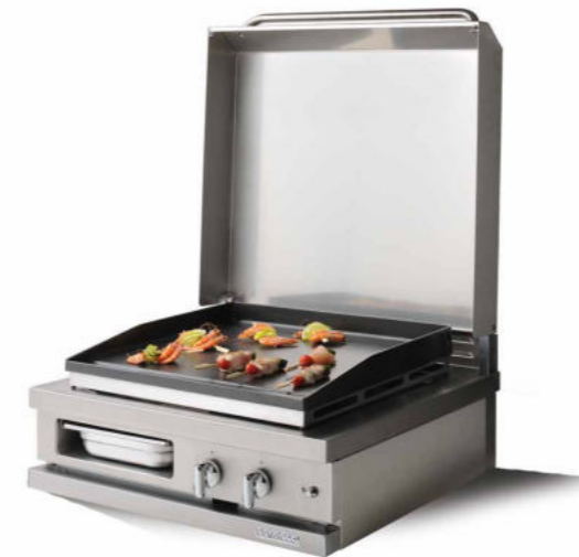
WSG 720 PL - C Plancha gaz 6 kW.