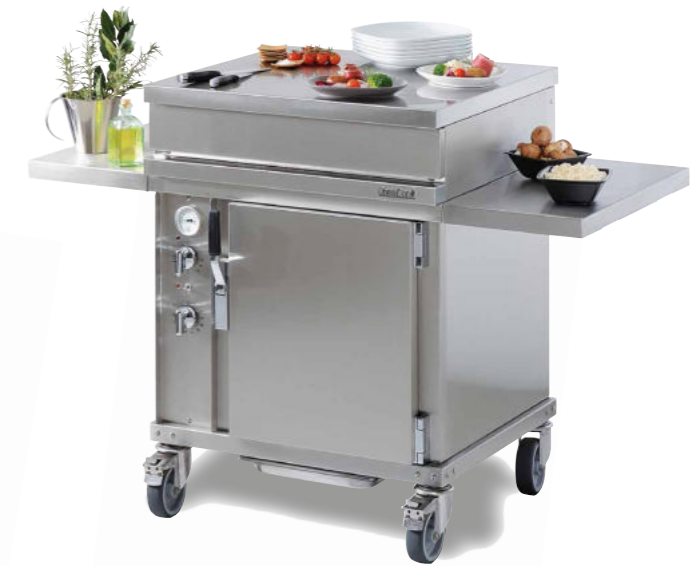
WTA 701 CT + 2 x WTDL 320 Four de cuisson et tablettes latérales de dépose.