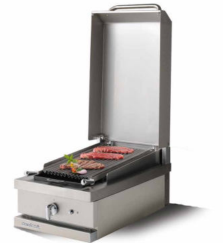
WSG 410 CKG - C Gril à pierres de lave gaz 4 kW.