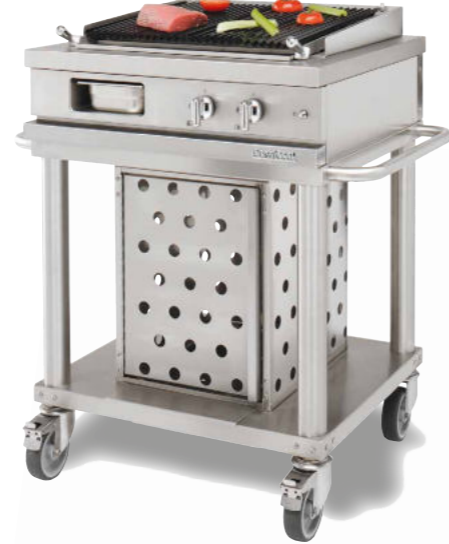
WTG 720 CGK Gril à pierres de lave 4 kW.