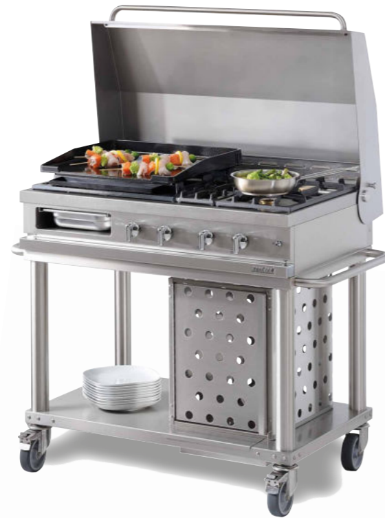
WTG 1040 PL - C Plancha gaz 6 kW et deux feux vifs gaz 3 kW.