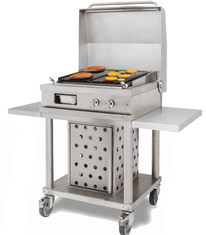
WTG 720 CKG - C Gril à pierres de lave 4 kW et tablettes latérales de dépose.