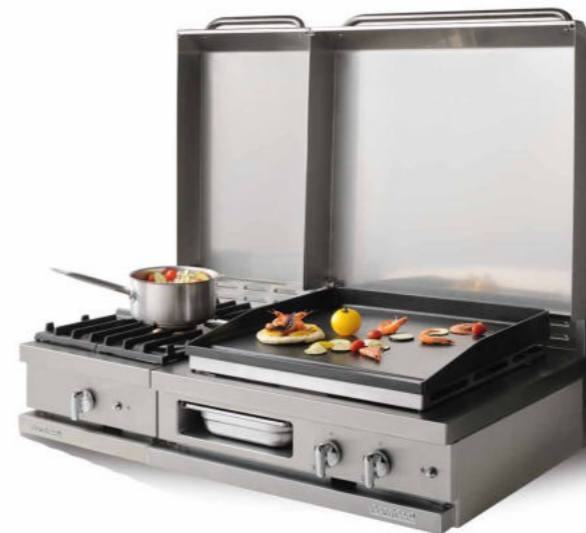
WSG 410 R - C + WSG 720 PL - C 1 feu vif gaz 5 kW, plancha gaz 6 kW.