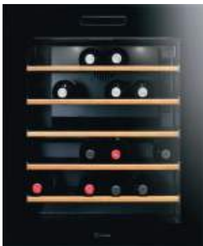
Vinoteca version encastrable

L min. 594 mm P min. 574 mm H min. 714 mm