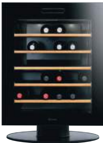
Vinoteca version à pose libre

L min. 608 mm P min. 615 mm H min. 850 mm